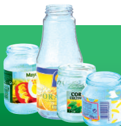
Les pots et les bocaux