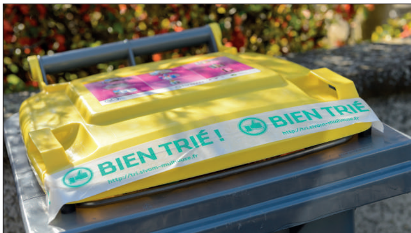
“Erreur de tri” ou “Bien trié” : en cas de contrôle, l’usager est informé de la qualité de son tri.