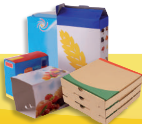
Les boîtes et emballages