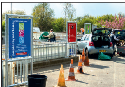
Les déchetteries du SIVOM sont particulièrement appréciées des usagers...

S'agissant de déchetteries intercommunales, les usagers peuvent se rendre dans celle de leur choix. Mais seuls les habitants des communes du périmètre de compétence du SIVOM ont un droit d'accès.