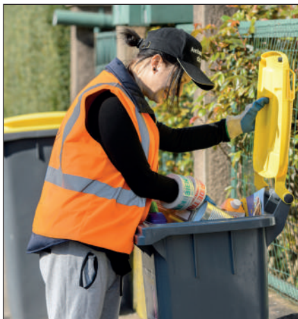
Les ambassadeurs du tri apposent un adhésif explicite lorsqu'ils constatent une erreur de tri et prennent contact avec l'utilisateur pour lui expliquer les consignes.

Ils opèrent également un contrôle qualité du tri effectué par les habitants, repèrent les dysfonctionnements et peuvent ensuite mieux orienter leur actions pour corriger les erreurs de tri.