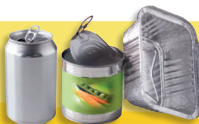
Boîtes de conserve, canettes et barquettes aluminium