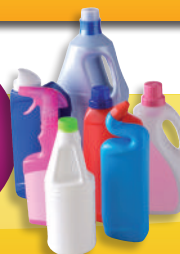
Les produits d'entretien et divers

Pensez à laisser les bouchons, ils sont aussi recyclables !