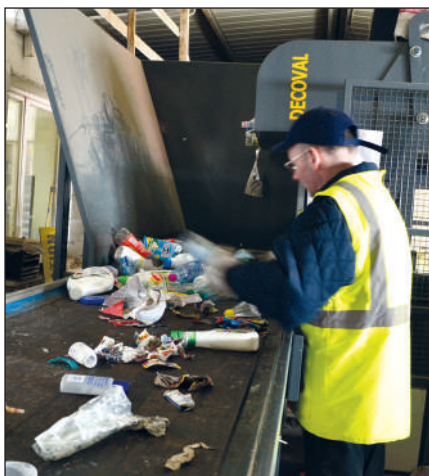
Table de tri manuel : des opérateurs retirent, non sans risques, les indésirables et autres « erreurs » de tri.