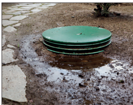
Fosse septique présentant des fuites.

Un premier recensement a établi un potentiel d'une centaine d'installations qui rempliraient les conditions pour bénéficier de cette participation financière. Le programme de travaux s'étalera sur 3 ans (2015/2017). La réhabilitation de 30 installations a d'ores et déjà été proposée pour le budget 2015. Les particuliers concernés seront contactés directement par le SIVOM. ■