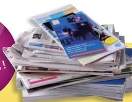
Les prospectus, magazines et journaux