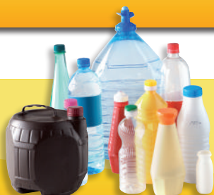
Les produits alimentaires (y compris les bouteilles d'huile)

Pensez à laisser les bouchons, ils sont aussi recyclables !