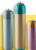
Les aérosols (sans les bouchons)