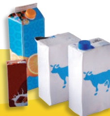
Les briques alimentaires